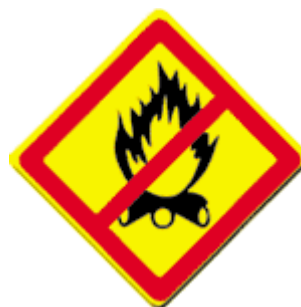
Запретительный знак «Разведение костров запрещено!»